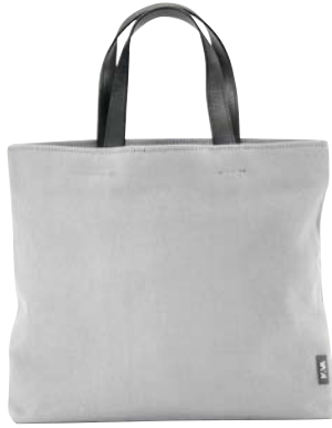
N02 - Casual cm 37 x 31 Borsa due manici con tracolla. Shopping bag with shoulder strap.