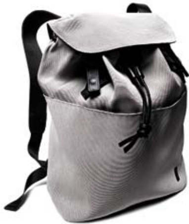
N07 - Back cm 42 x 32 x 15 Zaino coulisse con ampia tasca frontale. Coulisse backpack with magnetic closures and frontal pocket.