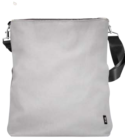
Modality 2: Shoulder