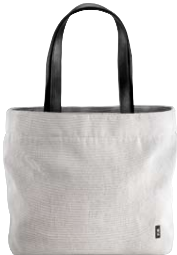
N04 - Large cm 33 x 40 x 12 Borsa due manici con chiusura a zip. Shopping bag with zip closure.