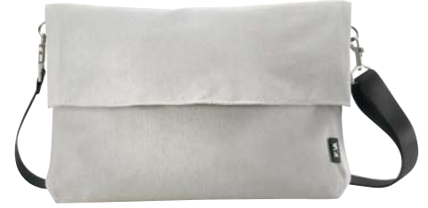
Modality 3: Postman