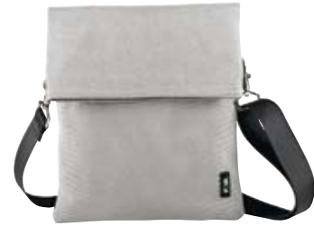
N03 - Pouch cm 25 x 21 Borsello con tracolla removibile. Pouch with removable shoulder strap.