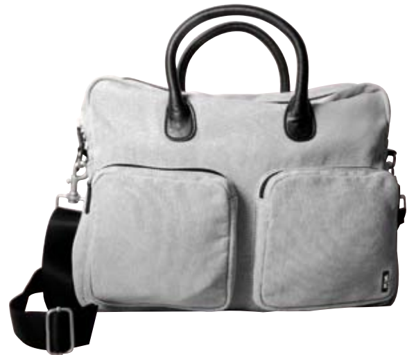
N13 - Briefcase cm 30 x 37,5 x 12 Borsa due manici con ampie tasche frontali e tracolla removibile. Two handles bag with large pockets and removable shoulder strap.