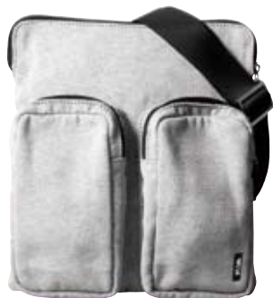
N09 - Saddle cm 26 x 23,5 x 7 Borsello con tracolla e due tasche frontali. Saddle bag with two frontal pockets.