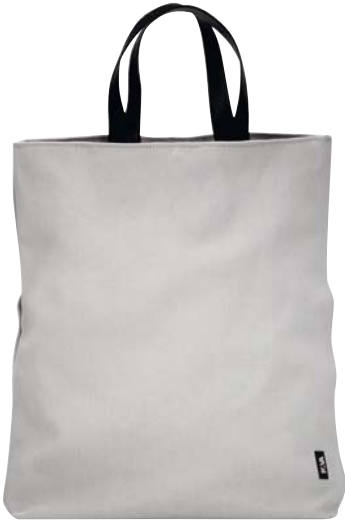
N06 - Tote large cm 40 x 37