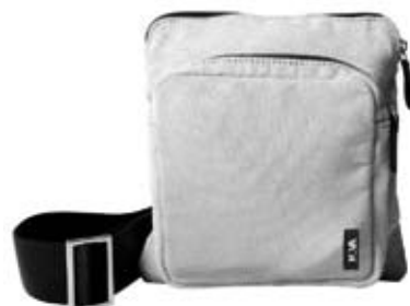
N10 - Mini cm 21 x 19,5 x 7 Borsello con tracolla con tasca frontale. Mini bag with frontal pocket.