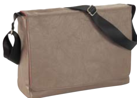
NL15 - Messenger cm 37,5 x 29 x 10,7 Messenger porta computer. Laptop messenger.