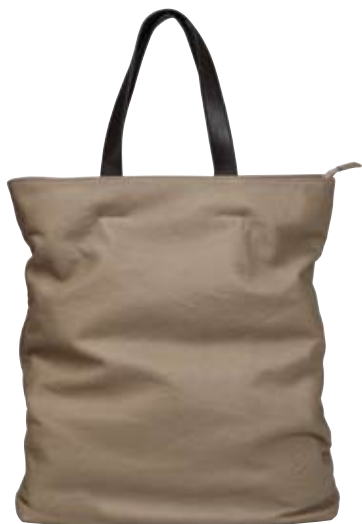
NL06 - Tote large cm 40 x 37 Borsa due manici con chiusura a zip. Shopping bag with zip closure.