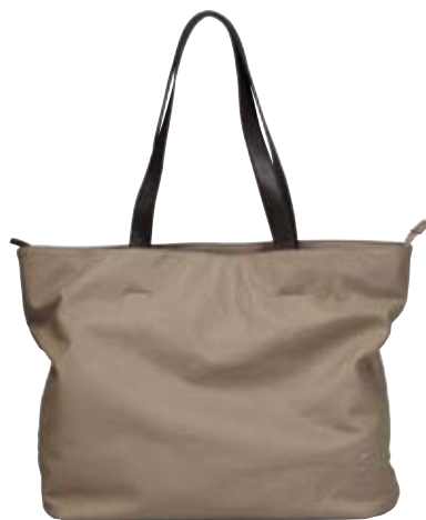
NL04 - Large cm 33 x 44 x 12 Borsa due manici con tracolla. Shopping bag with shoulder strap.