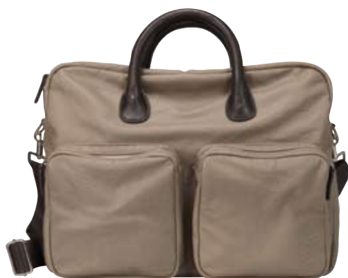
NL13 - Briefcase cm 30 x 37,5 x 12 Borsa due manici con ampie tasche frontali e tracolla removibile. Two handles bag with large pockets and removable shoulder strap.