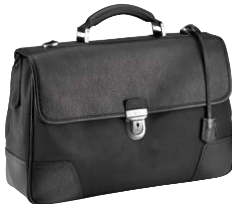
TY002 - One cm 27 x 40 x 12,5 Cartella organizzata a 1 chiusura Organized bag with 1 lock