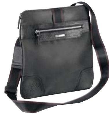
TY011 - A4 bag cm 32 x 30 borsa con tracolla shoulder bag