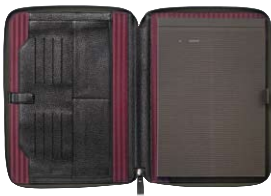
TY875 - Portfolio zip cm 33 x 24