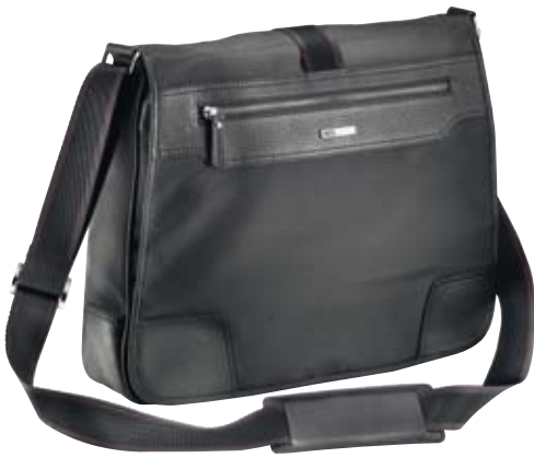
TY009 - Shoulder large cm 31 x 41 x 9 borsa a tracolla a 2 scomparti shoulder bag with two spaces