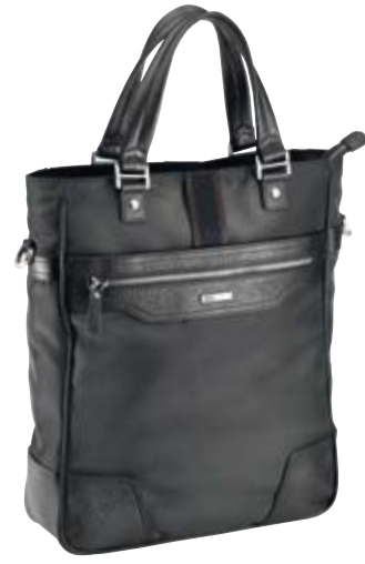
TY014 - Shopping cm 37 x 34 x 10