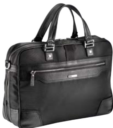
TY019 - Brief slim cm 30 x 41 x 8 Borsa portadocumenti con tasca anteriore organizzata, tasca centrale con portacomputer estraibile Organized front pocket bag, extractable computer holder