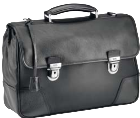
TY004 - Two cm 28 x 42 x 13 Cartella organizzata a 2 chiusure Organized bag with 2 locks