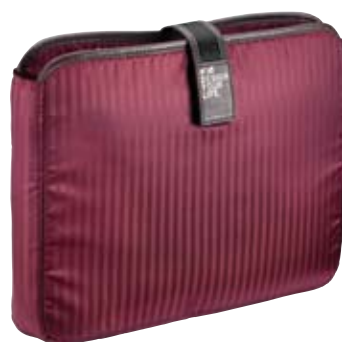
Porta pc estraibile incluso nelle cartelle. Extractable pc holder included in the bags.