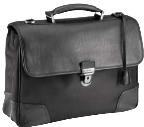
TY003 - One expander cm 30 x 42 x 11 (expander cm 30 x 42 x 14) Cartella espandibile organizzata a 1 chiusura Organized expandable bag with 1 lock