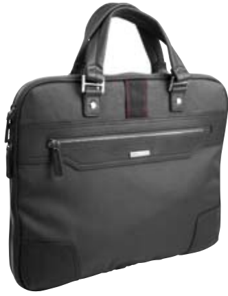
TY021 - Brief expander cm 33 x 42 x 4 Borsa portadocumenti espandibile con portacomputer. Organized expander with computer holder inside.