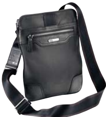
TY012 - Saddle cm 27 x 23 borsello con tracolla saddle bag